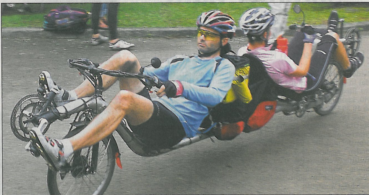
Dabei sein ist alles: Mit den verrücktesten Eigenbauten wurde die 1200 Kilometer lange Strecke gefahren.