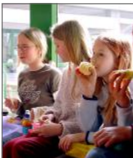
Schülerinnen während einer Obstpause

Zwei Gedanken möchte ich Ihnen in dieser Situation gerne mitgeben. Erstens: Vertrauen Sie dem Urteil und den Ratschlägen der Lehrkräfte der Grundschule und treffen Sie Ihre Entscheidung gemeinsam mit Ihrem Kind. Und zweitens: Lassen Sie die „gymnasiale Frage“ nicht zum alles beherrschenden Thema in Ihrer Familie werden. Mindestens genauso wichtig wie der Übertritt ans Gymnasium sind das ungetrübte Verhältnis zu Ihrem Kind und seine seelische Gesundheit.