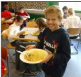
Mittagessen im Bistro

Fahrten und internationale Begegnung: z.B. Kennenlerntage, Skikurse, Schüleraustausch z.B. mit Frankreich, den USA und China, COMENIUS-Projekte der Europäischen Gemeinschaft, Studienfahrten, Auslandsaufenthalte (z.B. USA, Australien, Südamerika etc.); ein ausgearbeitetes Fahrtenkonzept sorgt für die Koordinierung;