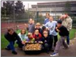
Kartoffelernte im Biogarten

Wahlunterricht und Arbeitsgemeinschaften: abhängig von Interesse und Stundenbudget z.B. Instrumentalunterricht, Chor, Orchester, Big Band, Werken, Textilarbeit, Photokurs, Spanisch, Chinesisch, Informatik, Textverarbeitung, Umweltgruppe, Schulgarten, englische Konversation, Politik und Zeitgeschichte, Pluskurse, differenzierter Sportunterricht (Gymnastik/Tanz, Tischtennis, alle Ballspiele einschl. Fußball, Schwimmen etc.), Webteam, Mathematik-Olympiaden, Jugend forscht, Schulspiel, auch englischsprachig;