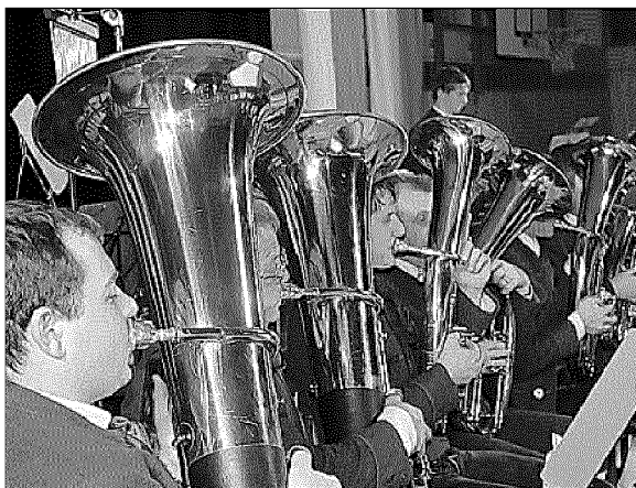
Die Blechbläser der Stadtkapelle beeindruckten mit Können und Volumen.